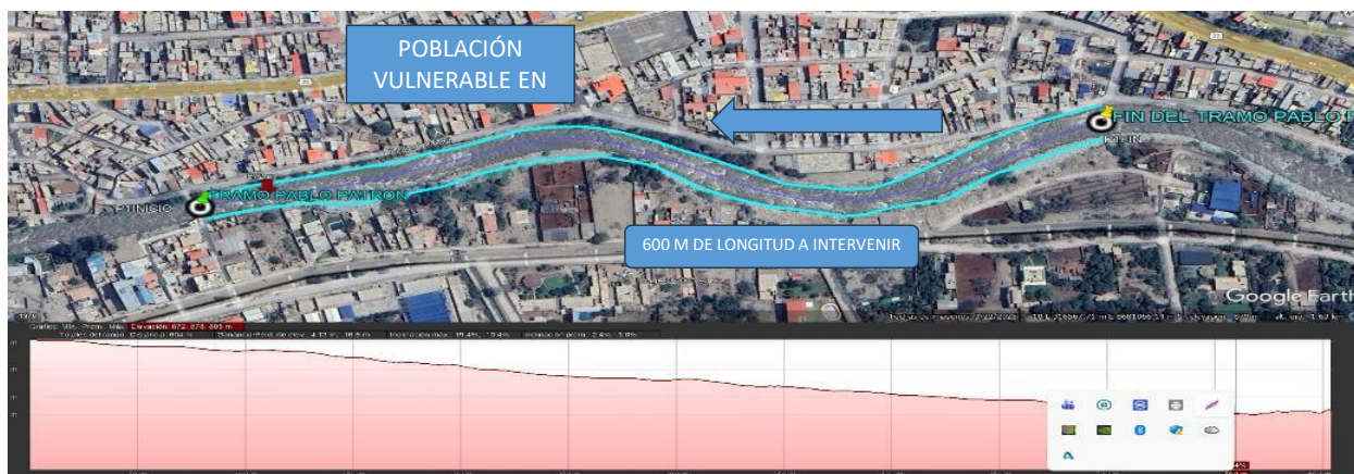
5.- IMAGEN SATELITAL DE ZONA VULNERABLE